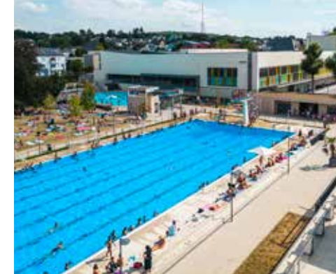
Piscine en plein air / Freibad / Outdoor pool