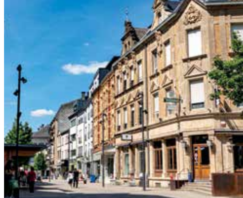
Centre-ville / Stadtzentrum / City centre