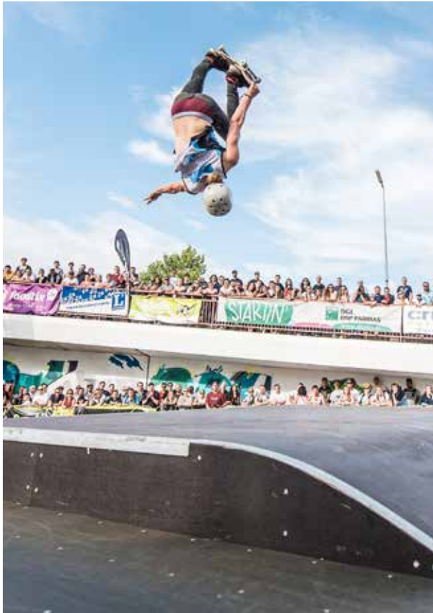
DUDELANGE ON WHEELS