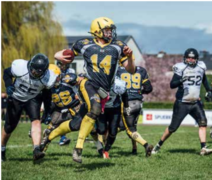
AMERICAN FOOTBALL IM J. F. KENNEDY-STADIUM